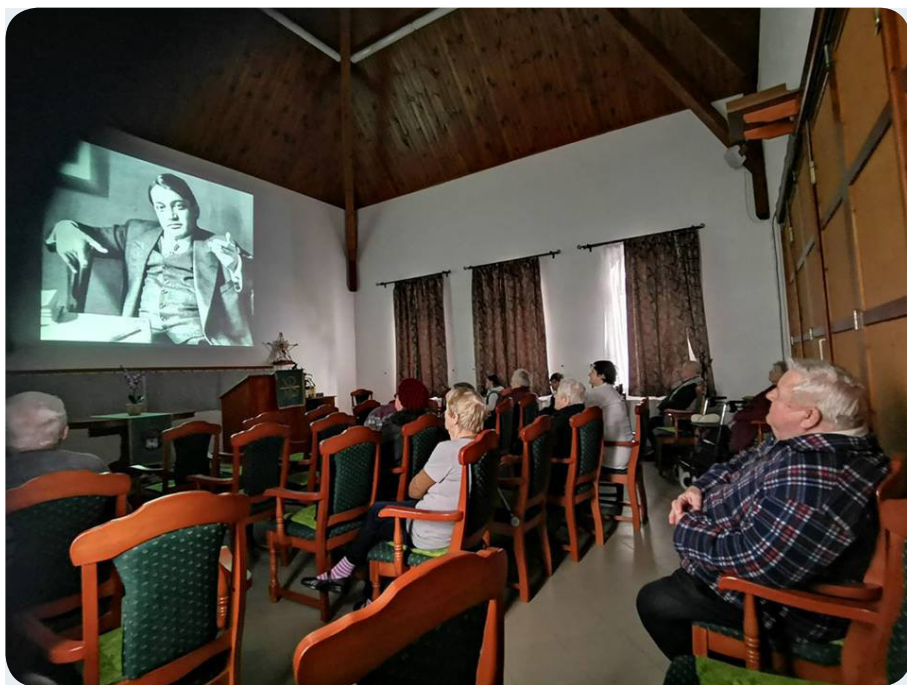
Ady Endre halálának 100. évfordulóján egy emlékszeállításon vehettek rész az érdeklődők.